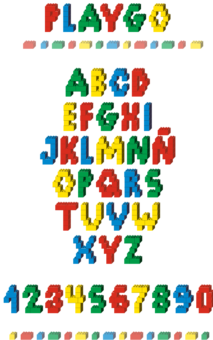
Alfabeto temático Afiche realizado por Manuel Salinas Castillo. Técnica vectorial. Curso de Tipografía y Diagramación, 2017.

escritores peruanos para la creación de libros postales. El punto de vista personal incluía parámetros comunicativos y expresivos, pero el diseño de autor preveía para el desarrollo de la representación comenzando con la selección de elementos, que abarcó momentos de la vida del escritor, obras, textos y contextos, para sugerir significados y valores de los escritores presentados; continuó con la composición y estética de cada postal.