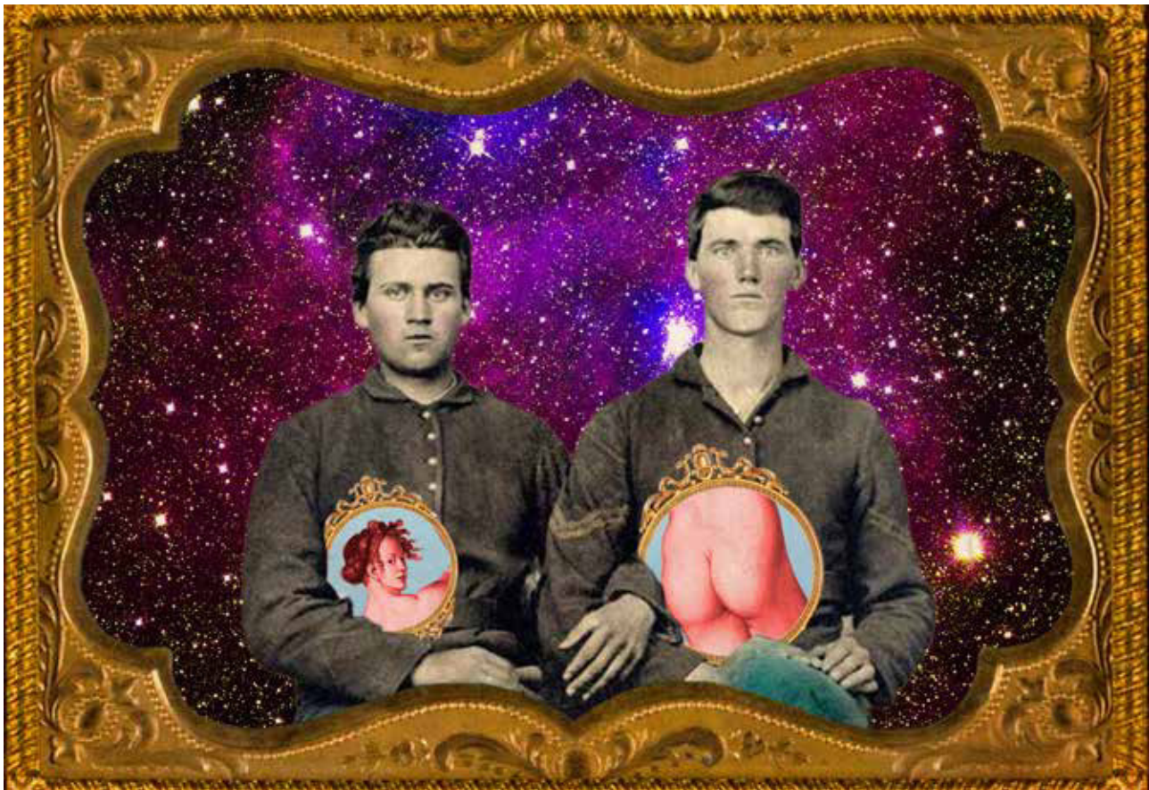
Arte Postal Interpretación de la obra de Jaime Bayly por Nagib Zariquey en estilo Surrealista. Curso de Proyectos Integrales 1, 2017.

a situaciones contemporáneas a la vez que amplió sus alcances geográficos. En MG3 comenzó también la línea de investigación de la moda, desde la perspectiva del diseño de autor, con el proyecto de marca VNRO y su tratamiento imaginativo de la peruanidad. MG 5, dedicado a la ilustración, contiene una serie de artículos que valoran el diseño de autor y exploran sus modos de acción y sus resultados: “La imagen múltiple en la ilustración de libros para niños” de Susana Venegas , “El libro ilustrado: un palpito en el corazón” de Diana Solórzano , “El universo expandido de la ilustración: el libro de autor” de Mihaela Radulescu , “El arte de la ilustración en el afiche cultural” de Felipe Cortázar, “La ilustración en el cine de animación” de Milagro Farfán. En el rubro “Estudios de Diseño” se expusieron proyectos de álbumes ilustrados, novelas gráficas y libros objeto.