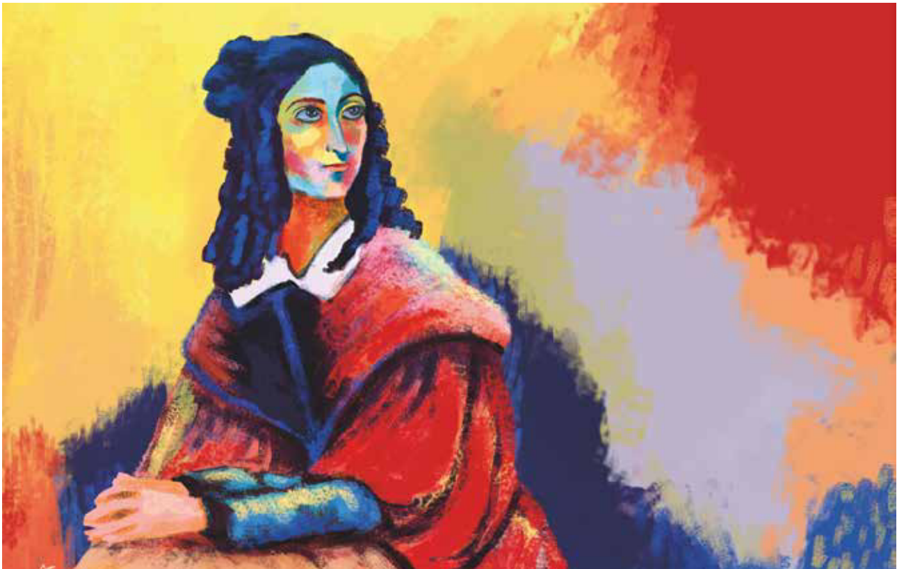
Arte Postal Interpretación de la obra de Flora Tristán por Angie Luz Cortéz en estilo fauvista. Curso de Proyectos Integrales 1, 2017.