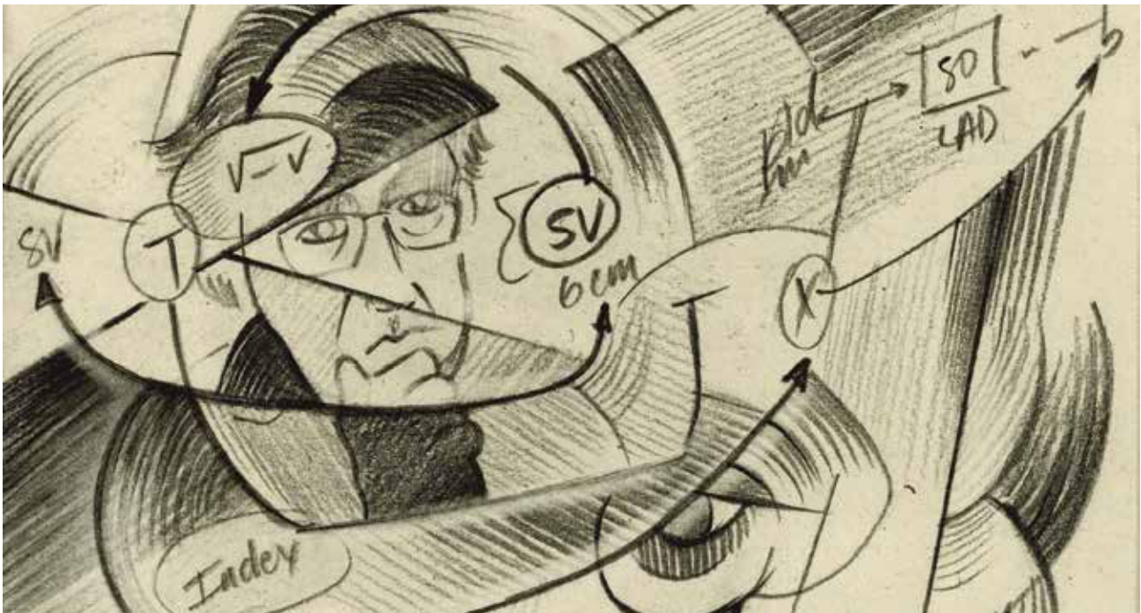
Arte Postal Interpretación de la obra de Mario Montalbetti por Miguel Angel de la Cruz en estilo cubista. Curso de Proyectos Integrales 1, 2017.