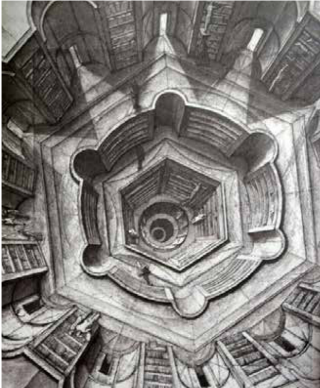
Jorge Luis Borges La biblioteca de Babel Ilustrada por Erik Desmazieres.

Políticas del imaginario . Buenos Aires: Ed. ArtexArte de la Fundación Alfonso y Luz Castillo.