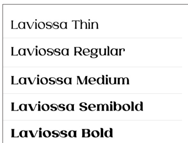
Figura 3. Familia tipográfica Laviossa Laviossa Complete Family, por Jehoo Creative, 2020, MyFonts ( https://www.myfonts.com/fonts/jehoo-creative/laviossa?tab=familyPackages )

Establecidas las tipografías, se empezó con la propuesta visual de la composición, debía resaltar lo más importante, al igual que, mostrar visualmente la frase. Por consiguiente, primero se definieron las palabras clave, las cuales son “hombres” y “verdad”. Estas tendrían el mayor peso visual en el boceto para resaltar su protagonismo. Por otro lado, se encuentran otra clasificación de palabras que tendrán un peso medio, debido a que presentan una relación directa con las palabras clave, las cuales son “no creen”, “caminan” y “sobre ella”. La disposición de las letras se daría dentro de un formato vertical en el cual las palabras se distribuirán de una forma balanceada para dar la sensación de armonía, véase figura 3.