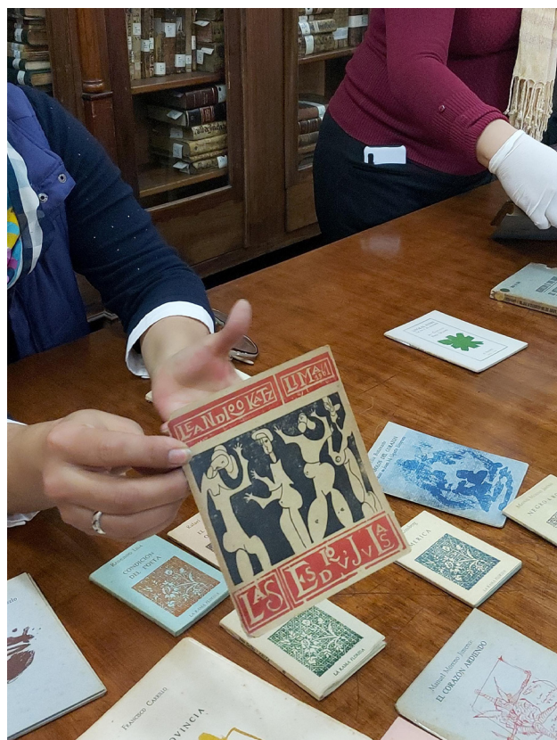
Figura 2. Edición Rama florida Bibliotecólogas en el Instituto Riva - Agüero