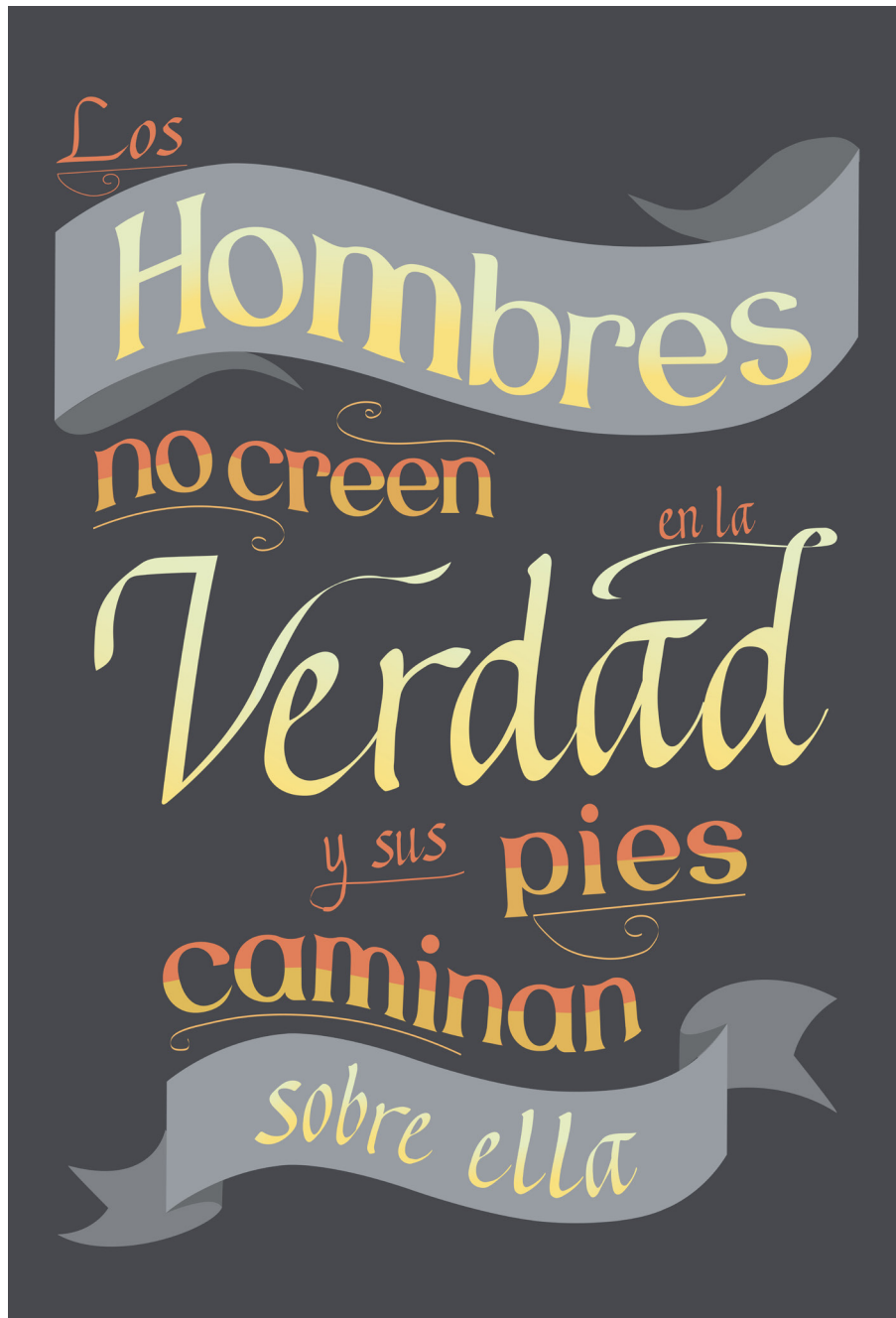
Figura 9. Lettering final

se aprendió sobre conceptos fundamentales de la tipografía; sin embargo, lo más importante fue que el diseño del lettering podría ser útil para la propagación y reflexión acerca de la poesía peruana y su aporte cultural. armonía con los colores oscuros y profundos.