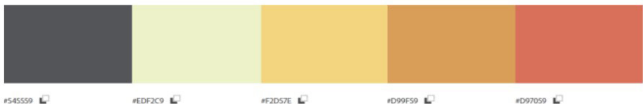
Figura 8. Paleta de color La paleta de color se creó en la plataforma Adobe Colors.

oscuro refleja la seriedad e importancia de la frase, lo que contrasta con los colores naranjas y amarillos que tradicionalmente son identificados por ser cálidos y, por ende, refleja al ser humano. Sin embargo, en el trabajo se utilizan estos colores con una saturación más apagada y dirigida al blanco, logrando así una mejor armonía con los colores oscuros y profundos.