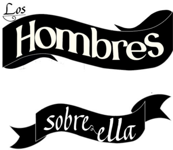
Figura 6. Elementos gráficos En la imagen se pueden apreciar en detalle los dos tipos de banners que se emplearon.