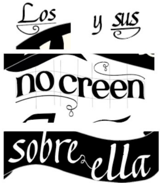
Figura 7. Florituras Detalles en donde se aprecia el uso de las florituras.

Por otra parte, el color fue un elemento crucial para poder representar con correctamente el objetivo, por esta razón se empleó una armonía de color de colores fríos en donde se resalta el contraste entre la gama de los grises con el amarillo, véase figura 6. Las tonalidades con temperatura fría comunican una sensación profunda y racional, lo que concuerda con el fragmento elegido. Por ejemplo, el fondo gris