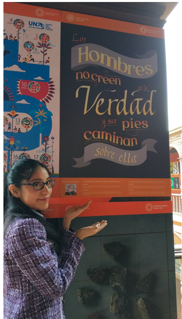
Figura 11. Bienal de Diseño / Obra y autora en la exhibición de la Bienal de Diseño del Perú, 2021. Museo de Santo Domingo.