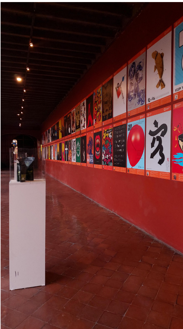
Figura 10. Bienal de Diseño del Perú, 2021. Museo de Santo Domingo. Lima, Perú.

en las diversas áreas del diseño. Se escogen trabajos que sean modelos del buen desempeño, innovación y que presenten un propósito cultural y/o social ( Bienal de diseño de Perú, 2022). De esta forma, al ser la Bienal una oportunidad de notoriedad y de resonancia, se potencia el factor transformador del diseño de lettering, debido a que permite una mayor difusión de este y reconoce que es un diseño consciente de su cultura, influyente para la percepción de esta en la población e impulsor de conocimiento.