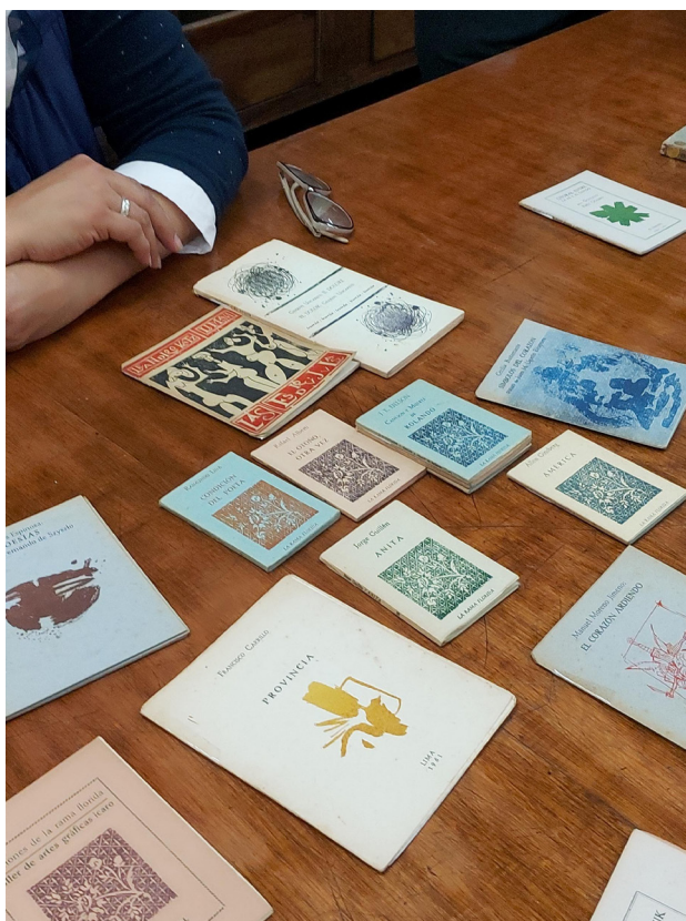
Figura 1. Edición Rama florida Foto tomada en el Instituto Riva - Agüero

ejemplificado en sus ilustraciones y formato los cuales eran realizados por diversos artistas. Por estas razones, surge su factor diferenciador de otros poemarios (Cosio, s.f.). La Rama Florida, en otras palabras, presenta una relación íntima entre las artes plásticas y la poesía convirtiéndose en un producto netamente sensible y expresivo. Todas estas cualidades debían estar reflejadas en el diseño de lettering, ya que el diseño sería el medio en el que se difundiría, representaría, transformaría la esencia e importancia de la contemporánea cultura literaria peruana para así generar una reacción del público. De esta forma, el lettering debía cautivar lo elemental de uno de los poemas de esta colección y representar visualmente su personalidad a través de la tipografía y sus formas, la composición, el color, los trazos, etc.