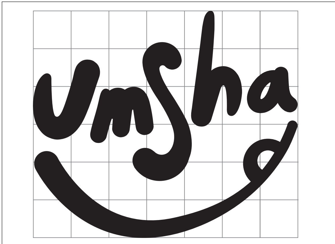
Figura 12. Umsha