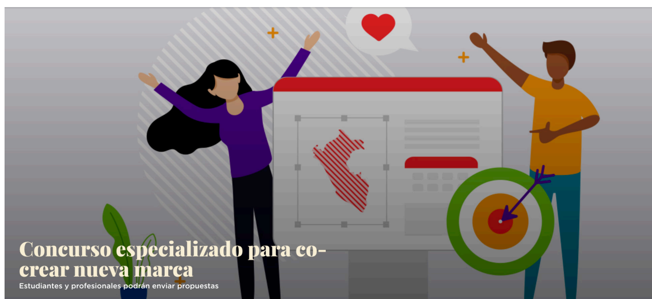
Figura 6. Convocatoria

Cuando me preguntan sobre el proceso creativo para esta propuesta, siempre respondo que fue