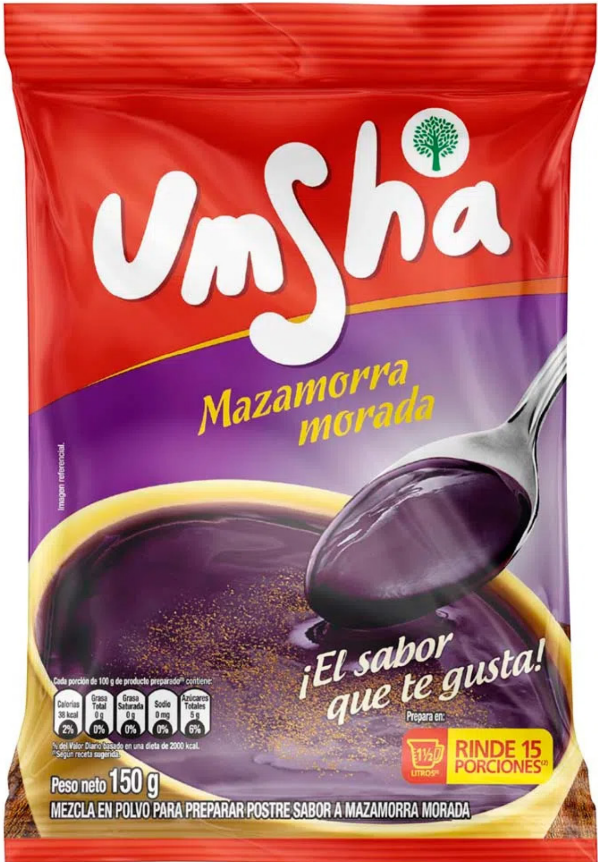
Figura 01. Producto Umsha.