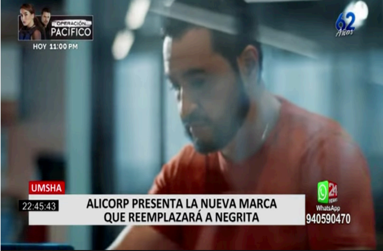
Figura 10. Trabajando