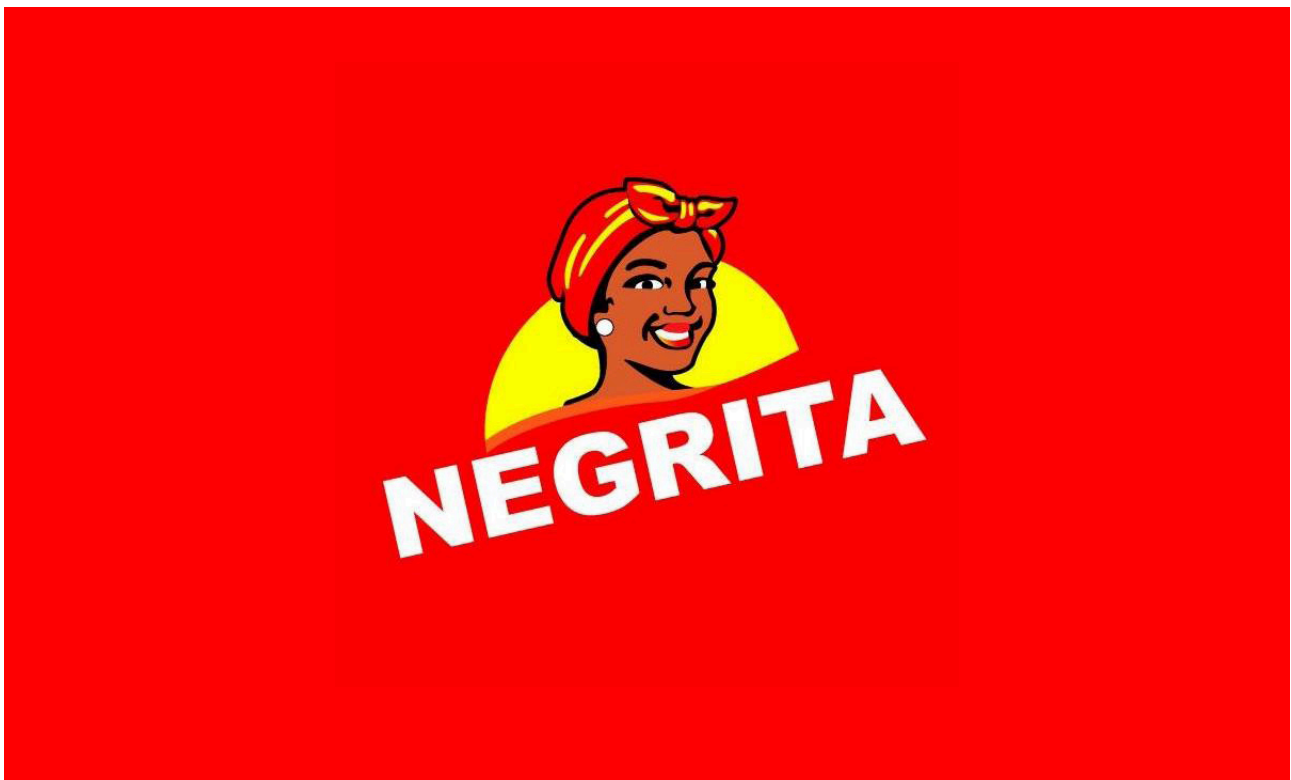
Figura 5. Logotipo Negrita

Según el portal de la empresa Alicorp https://cutt.ly/sHM89Dt , la idea primigenia era ser inclusivos con este grupo étnico asociado a esclavas cocineras negras que tenían gran sazón, famosas desde tiempos de la colonia. Sin embargo, esta inclusión terminó siendo considerada una estigmatización de la mujer afroperuana a través de la imagen de su ancestro como una esclava con ciertas caracte-