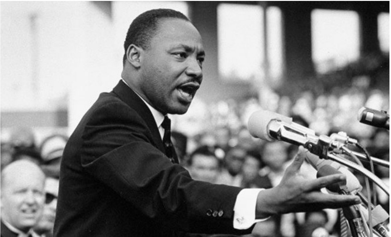
Figura 02. Martin Luther King.

¡Hoy tengo un sueño! Martin Luther King.