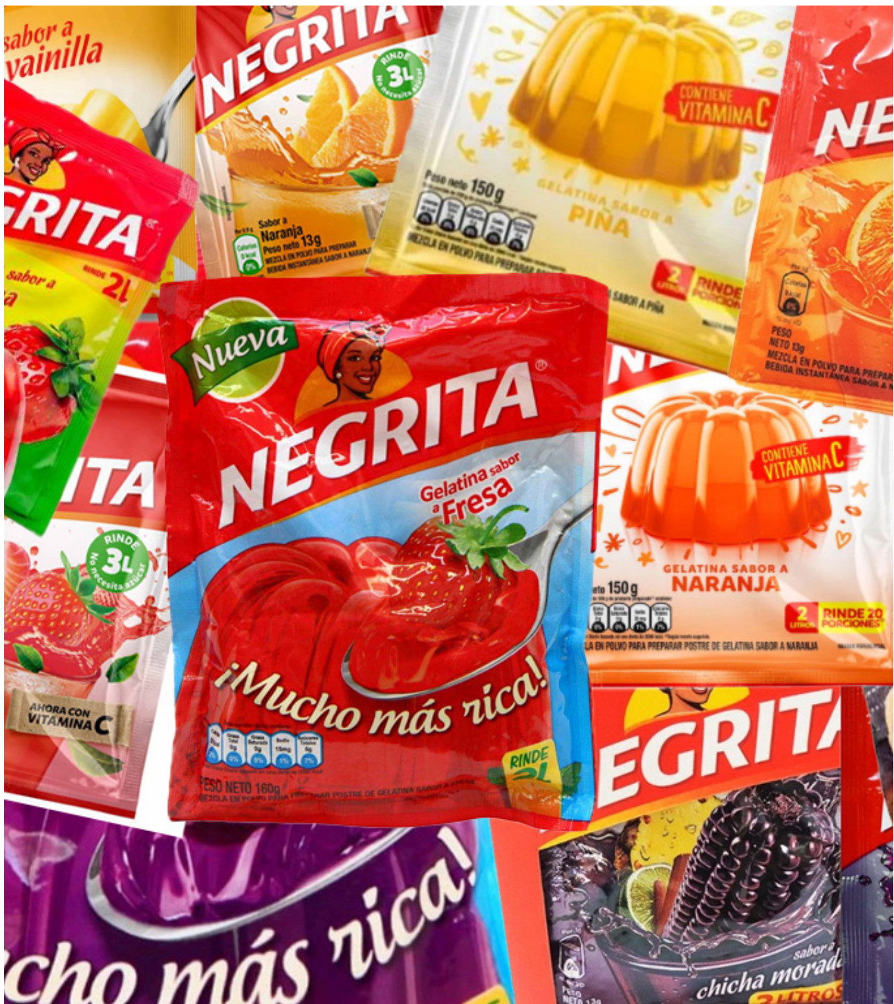
Figura 8. Productos negrita collage

relación establecida ya con los clientes. (Fig. 11) El lettering utilizado funciona correctamente en colores planos y degradados pero se optó por la versión en blanco para que sea legible sobre el tradicional fondo rojo de la mayoría de empaques de repostería de la marca.