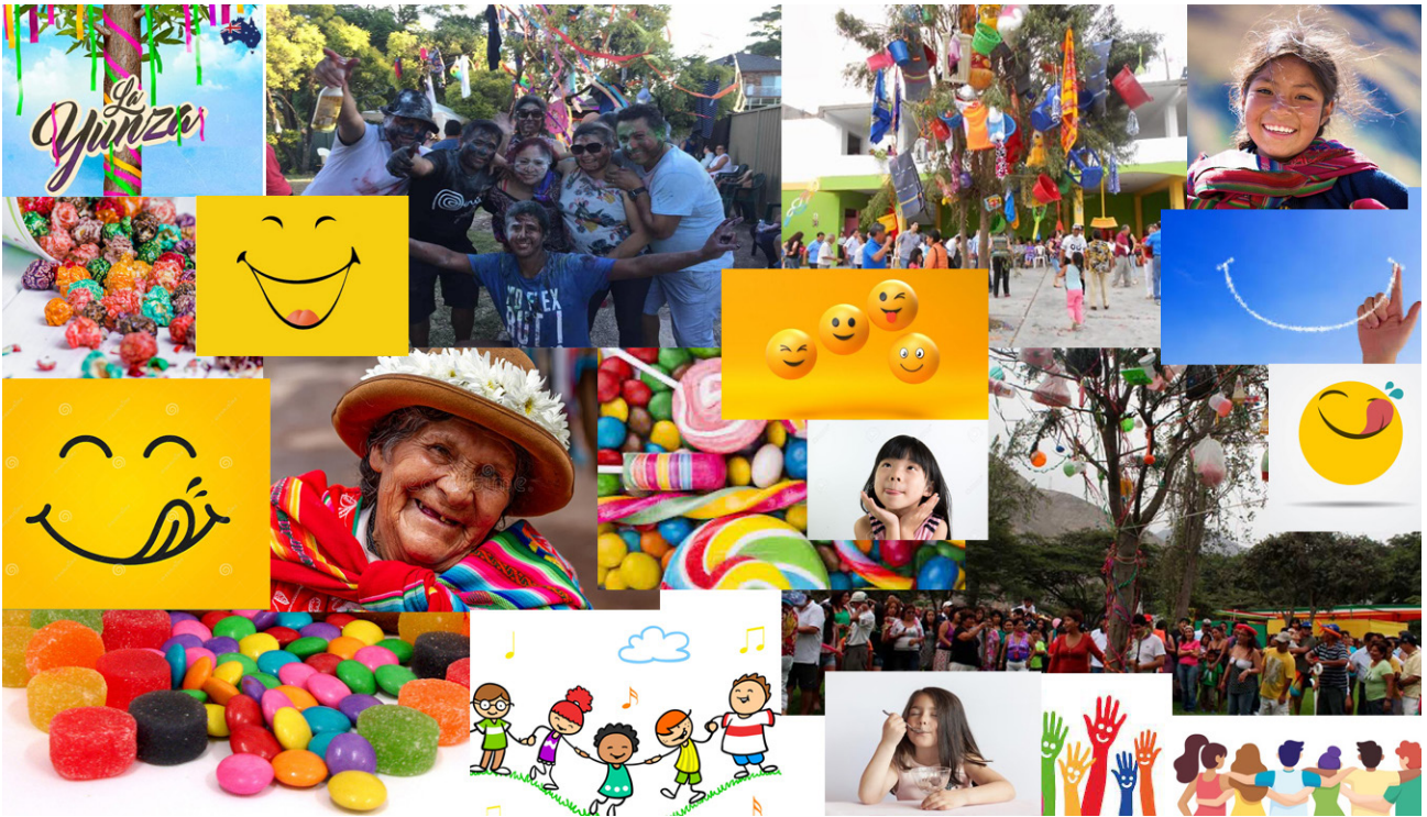
Figura 9. Umsha moodboard