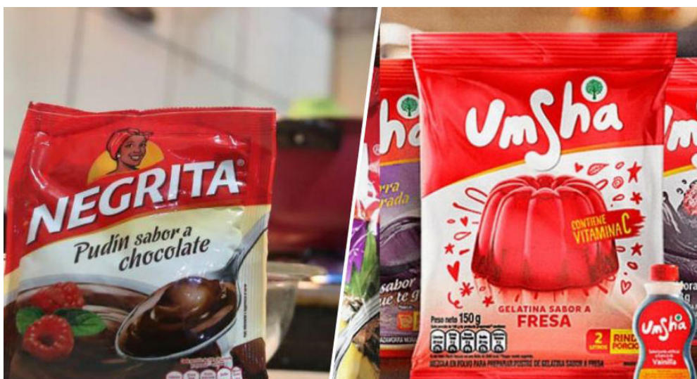
Figura 14. Productos Umsha en el mercado