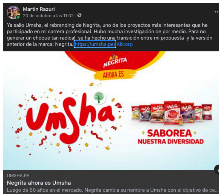
Figura 13. Rebote en medios

Los tiempos han cambiado, y sin duda las empresas han comprendido que les va tocando adaptarse para seguir en la contienda por la conquista de los consumidores y usuarios de sus marcas.