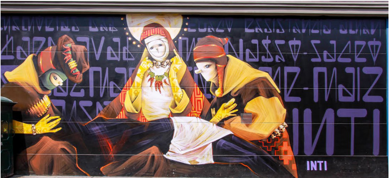
Figura 6. INTI