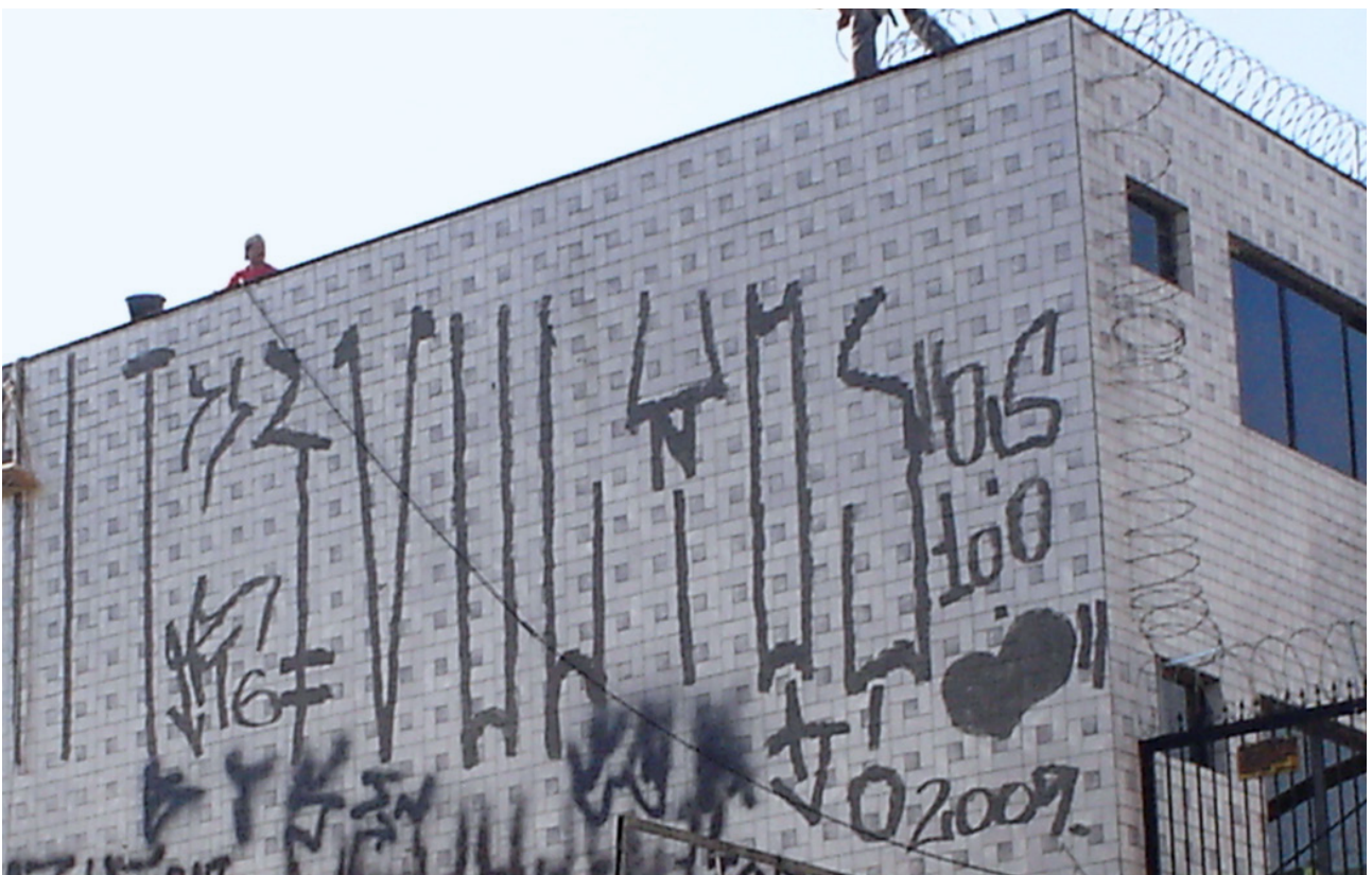
Figura 3. Pixacao