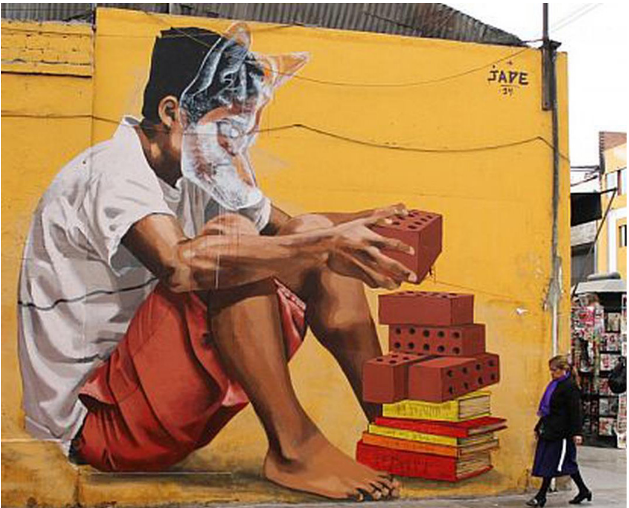
Figura 7. Jade Rivera