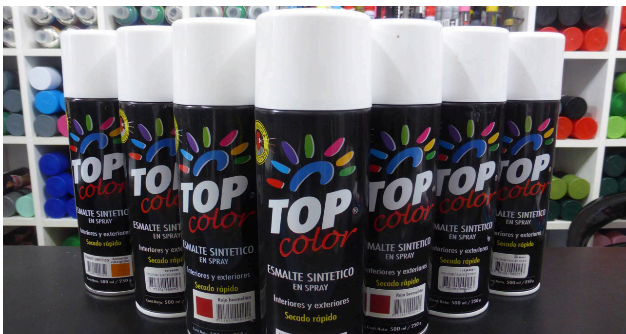
Figura 4. Top Color

En el 2008 tuve la oportunidad de viajar a mar del Plata, Argentina al congreso internacional de diseño TRIMARCHI DG 16 , en ese viaje tuve la oportunidad de pintar con algunos amigos de la ciudad. Aquella vez llevé una revista peruana de graffiti llamada “ Sin Normas ”, mis amigos argentinos se quedaron maravillados con la cantidad de graffiti que se produce en nuestro