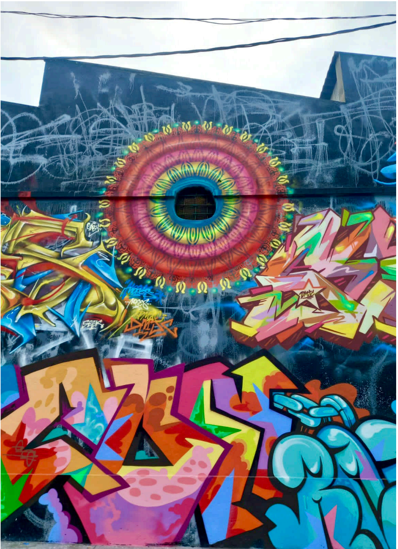
Figura 1. DMJC Cans in the city 4