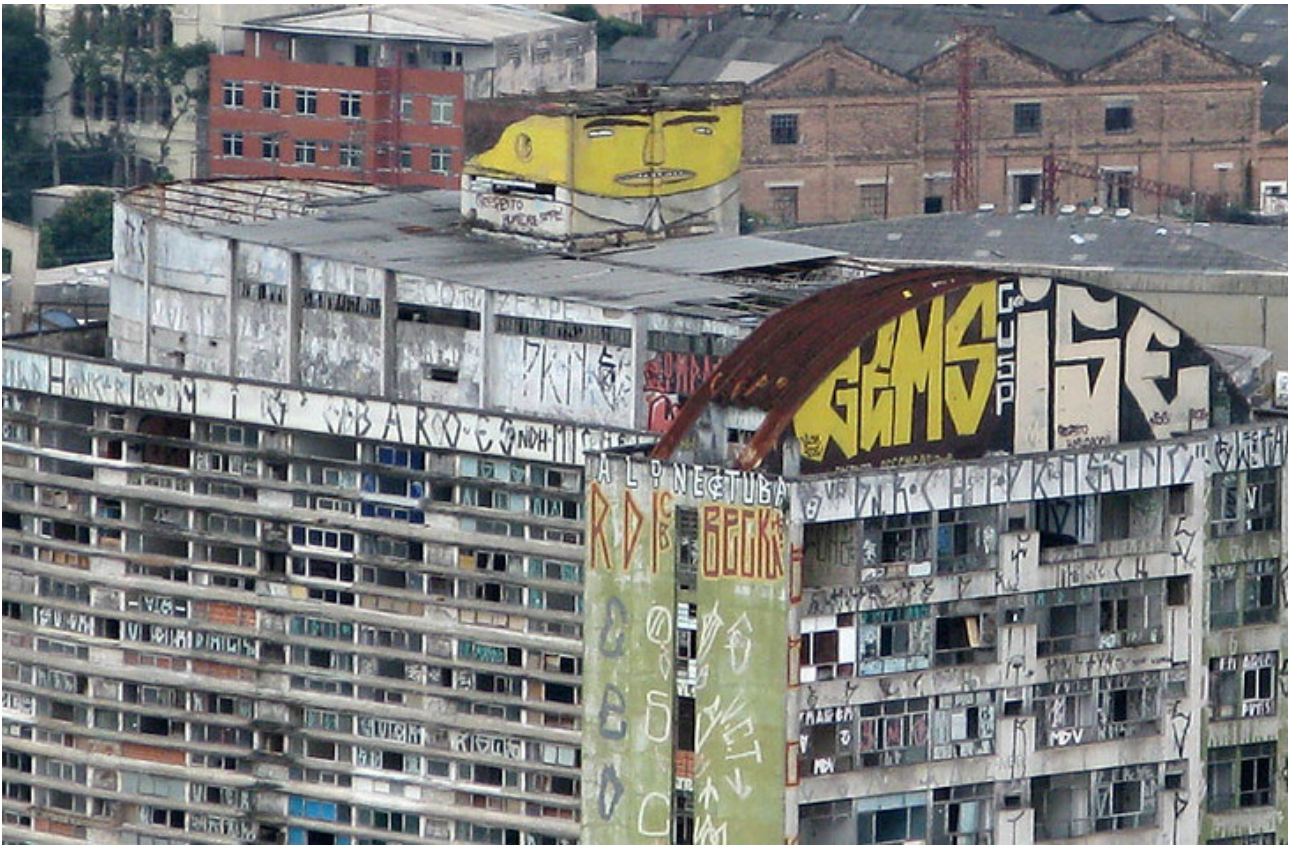
Figura 2. Os gêmeos