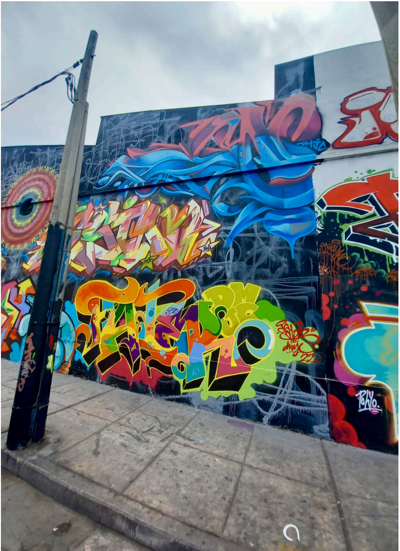
Figura 10. DMJC Cans in the city 4