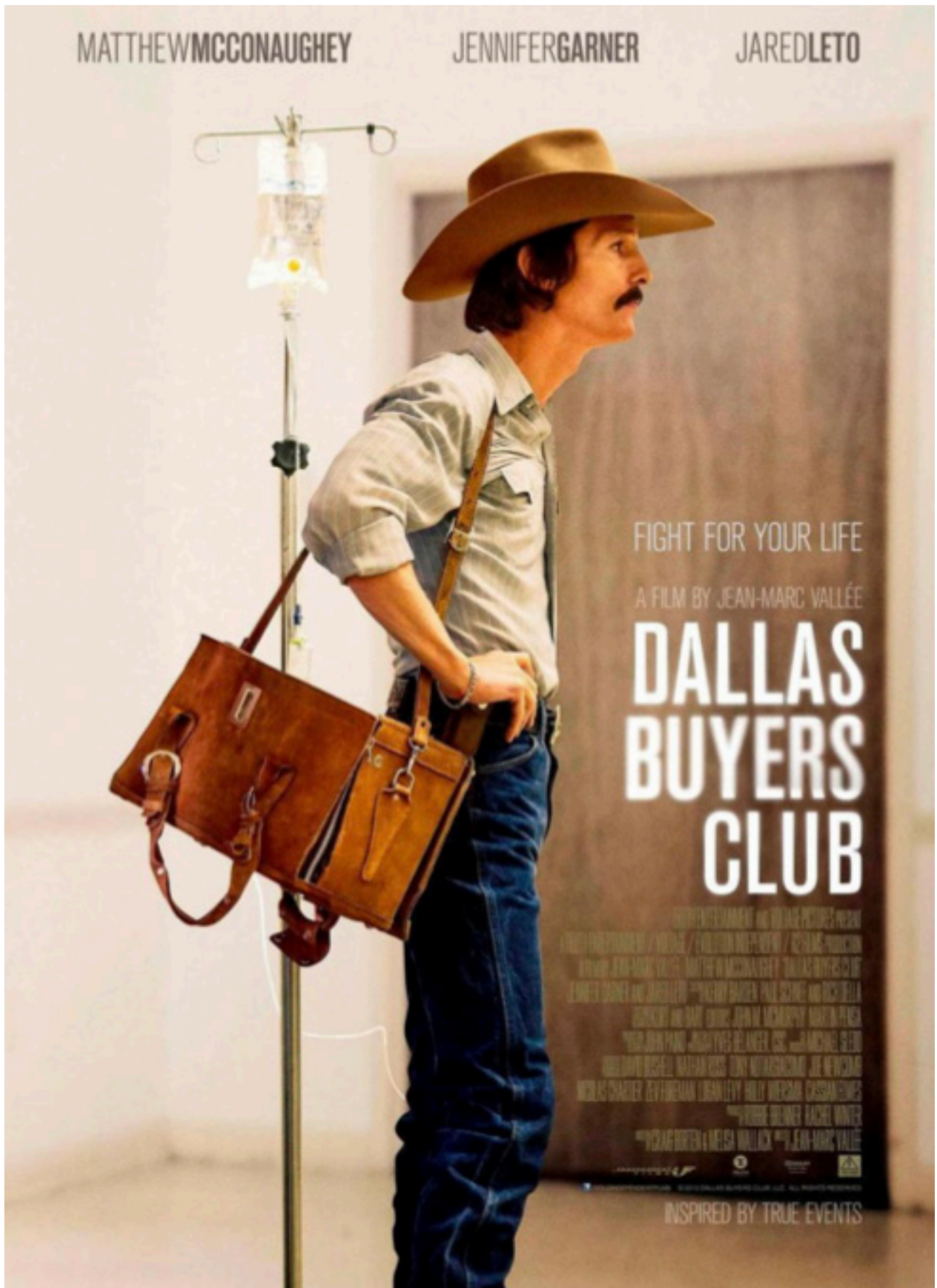
Figura 3. Portada, película Dallas Buyers Club