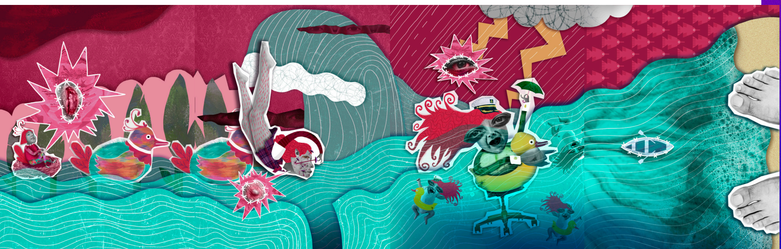
Imagen 4. Vejez