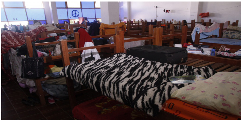
Figura 1. Imagen del alojamiento de la Unión Universitaria. Reproducción de X autorizada, 2016.