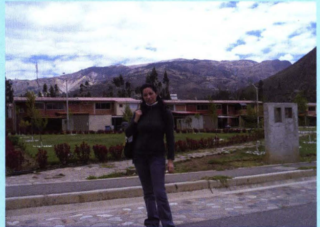
Campamento de Barrick Misquichilca (La Alborada)-La Pierina, Mina Barrick-La Pierina

En realidad, existen importantes recursos que se obtienen de la minería que, bien dirigidos, deben tener un impacto en la mejora de las condiciones de vida de la población asentada en las áreas de influencia minera, generalmente en pobreza o en pobreza extrema. Sin duda, el tema del manejo de los recursos es bastante complejo y complicado a su vez, porque es mane-