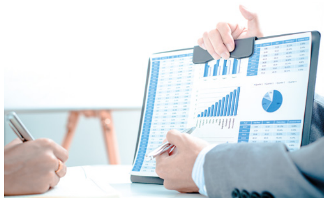
Tabla 1. Definición del costo

Los procesos de enseñanza-aprendizaje en contabilidad de gestión suponen prácticas que privilegian los temas concretos e instrumentales