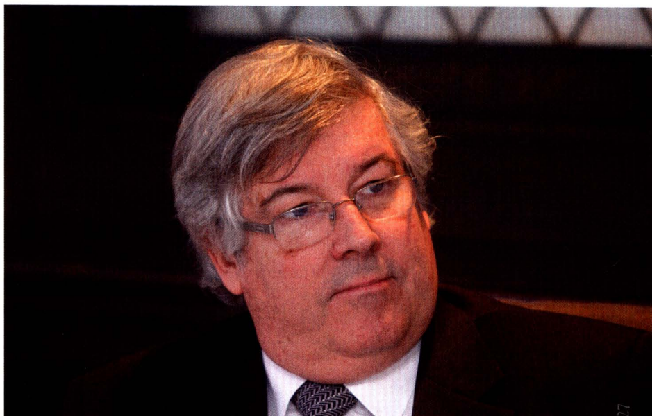
Hans Flury, presidente de la Sociedad Nacional de Minería, Petróleo y Energía.