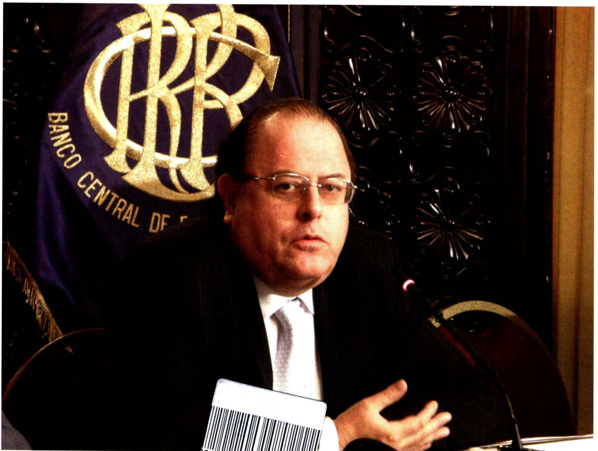
Julio Velarde, presidente del Banco Central de R

Por su parte, el presidente del BCR, Julio Velarde, mostrando su