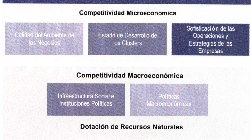
Figura 1: Determinantes de la Competitividad

Nota: Michael E. Porter, Harvard Business School