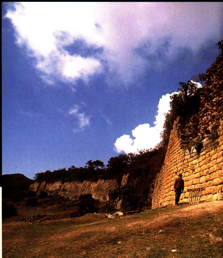
Otras maravillas. Del Perú al mundo: los restos arqueológicos de Kuélap.

Este desarrollo, sin embargo, no es algo exclusivo del Perú. Si bien este país ha crecido mucho, otros destinos turísticos del continente, como Brasil o México, han tenido un mayor despegue. El auge, según Guillermo Reaño, es parte de una tendencia mundial: la industria de viajes y turismo apor-