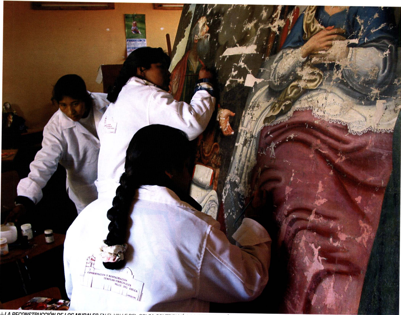
+ LA RECONSTRUCCIÓN DE LOS MURALES EN EL VALLE DEL COLCA CONTRIBUYÓ A LA CONSERVACIÓN DEL PATRIMONIO HISTÓRICO Y A LA RECUPERACIÓN DE LA IDENTIDAD CULTURAL DE LA POBLACIÓN.

Pero en esta Tierra globalizada, donde importan los tratados comerciales y las relaciones internacionales, los conceptos han cambiado y una conquista no se logra disparando bombazos desde la cubierta de un buque. La nueva cara de la conquista es la cooperación para los países en vías de desarrollo. Cooperación. Cooperar. DICCIONARIO DE LA REAL ACADEMIA DE LA LENGUA ESPAÑOLA: obrar en conjunto por un mismo fin. «De lo que se trata principalmente es de cómo dar buen uso a los notables beneficios del intercambio económico y del progreso tecnológico en una forma que preste la atención debida a los intereses de los desposeídos y desvalidos», dice el premio Nobel de economía Amartya Sen en su libro PRIMERO LA GENTE . ¿Pero, a qué se debe esta cooperación?