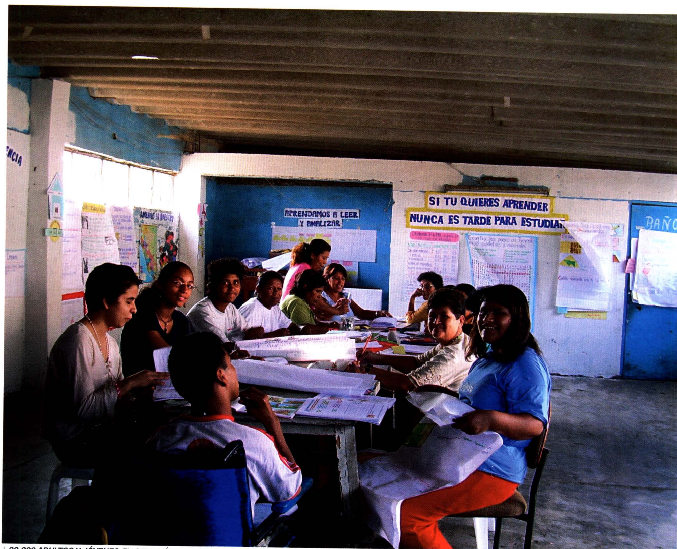
+80,600 ADULTOS Y JÓVENES EN SITUACIÓN DE POBREZA A NIVEL URBANO SE BENEFICIAN CON EL PROGRAMA DE ALFABETIZACIÓN Y EDUCACIÓN BÁSICA PARA ADULTOS.

requieren para ser competitivas y poder acceder así a los créditos financieros que son administrados por entidades peruanas como COFIDE, Mibanco, Edpyme Proempresa, Edpyme Crear Arequipa, Edpyme Confianza, CMAC Arequipa, CMAC Trujillo, CMAC Sullana, entre otras. Ellos reciben un préstamo que puede variar entre 557 dólares y 5,237 dólares. Según las cifras que brinda la AECID, de un total de 73 millones de euros, el 62% de estos pequeños montos se destina al sector comercio. El resto se va a sectores como servicios (22%), industria (11%) y agro (5%). El objetivo del programa: la equidad de género. La razón: el 62% de los microcréditos han sido otorgados a mujeres, integrando el concepto de igualdad sexual en el acceso a los fondos.