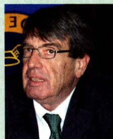
Peter Anders Presidente de la Cámara de Comercio de Lima (CCL)

En general, el Gobierno debería acelerar la inversión pública para frenar la desaceleración de la economía, debido a que, en el primer semestre, solo se gastó un tercio de los US$ 3,200 millones contemplados en su plan de estímulo económico. En suma, la proactividad de las autoridades económicas será importante para revertir el actual enfriamiento económico. ■