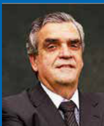
Carlos Alfredo Lazary Teixeira Embajador de Brasil en el Perú