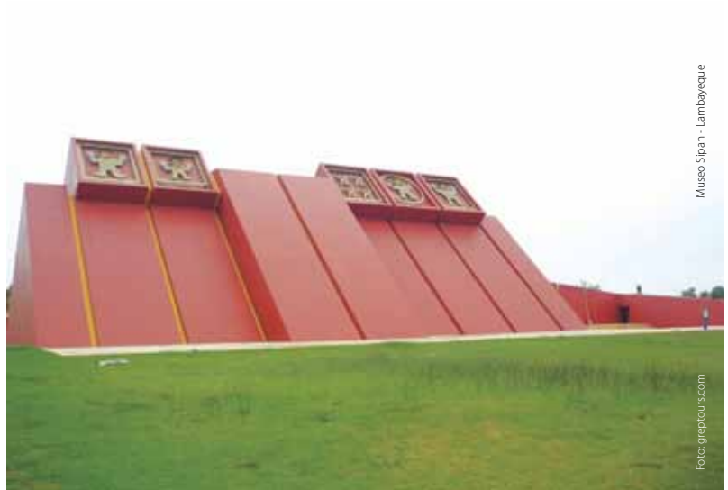
Museo Sipan - Lambayeque