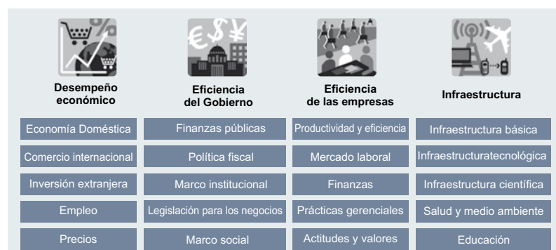
Figura 1. Factores considerados en la metodología de la medición de competitividad del IMD