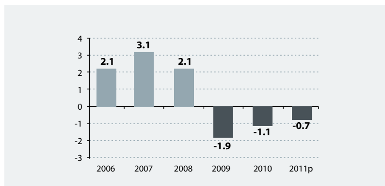
Figura 2. Déficit fiscal (% del PBI). De National Bureau of Statistics of China. Elaboración, Macroconsult.