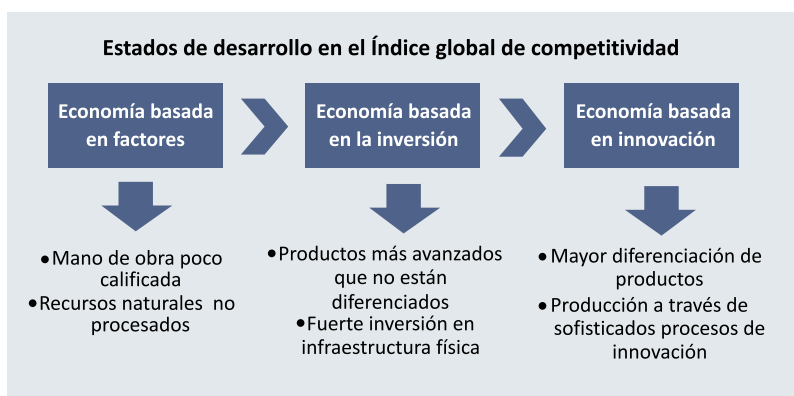
Nota: World Economic Forum. Elaboración: IEES-SNI.

“Aún no hemos logrado dar un paso firme hacia la incorporación de una canasta de productos con mayor contenido tecnológico; todo lo contrario, mantenemos una amplia base de productos mayoritariamente primarios y basados en recursos naturales, lo que nos resta competitividad en las importaciones mundiales, pero también a nivel interno”, agrega el IEES.