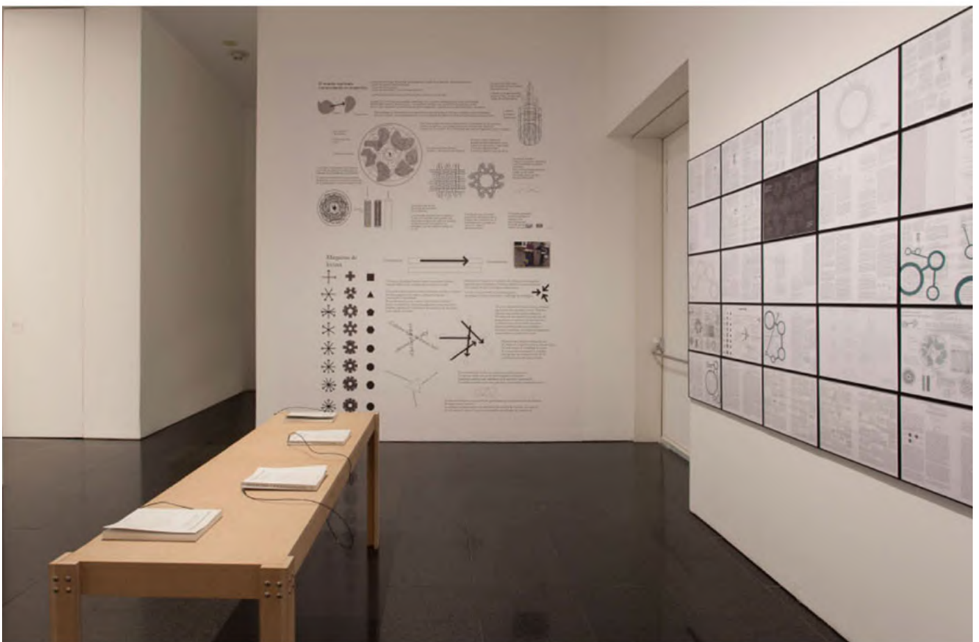
Fotografías de la exhibición El mundo explicado .