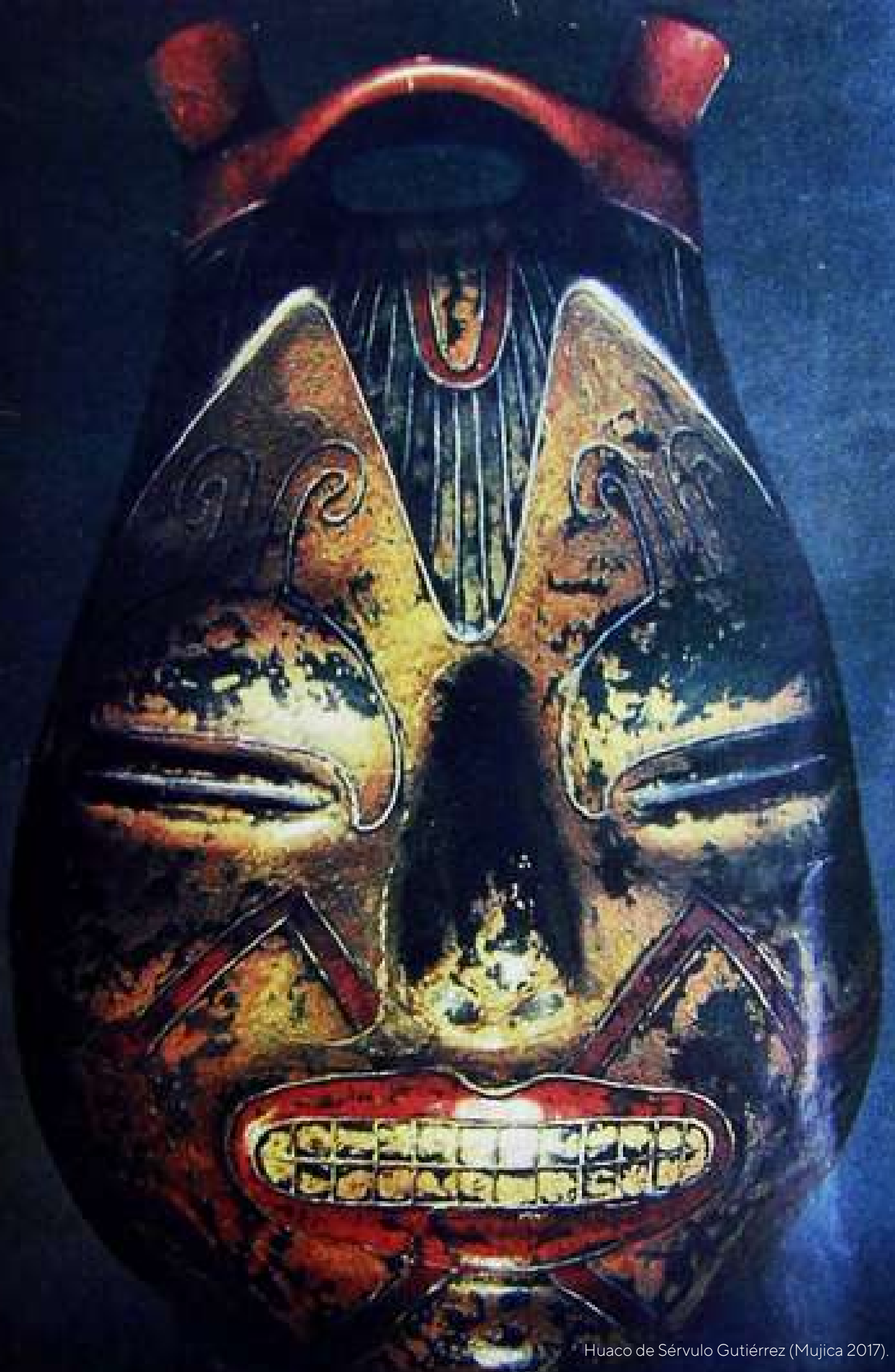
Huaco de Sérvulo Gutiérrez (Mujica 2017).