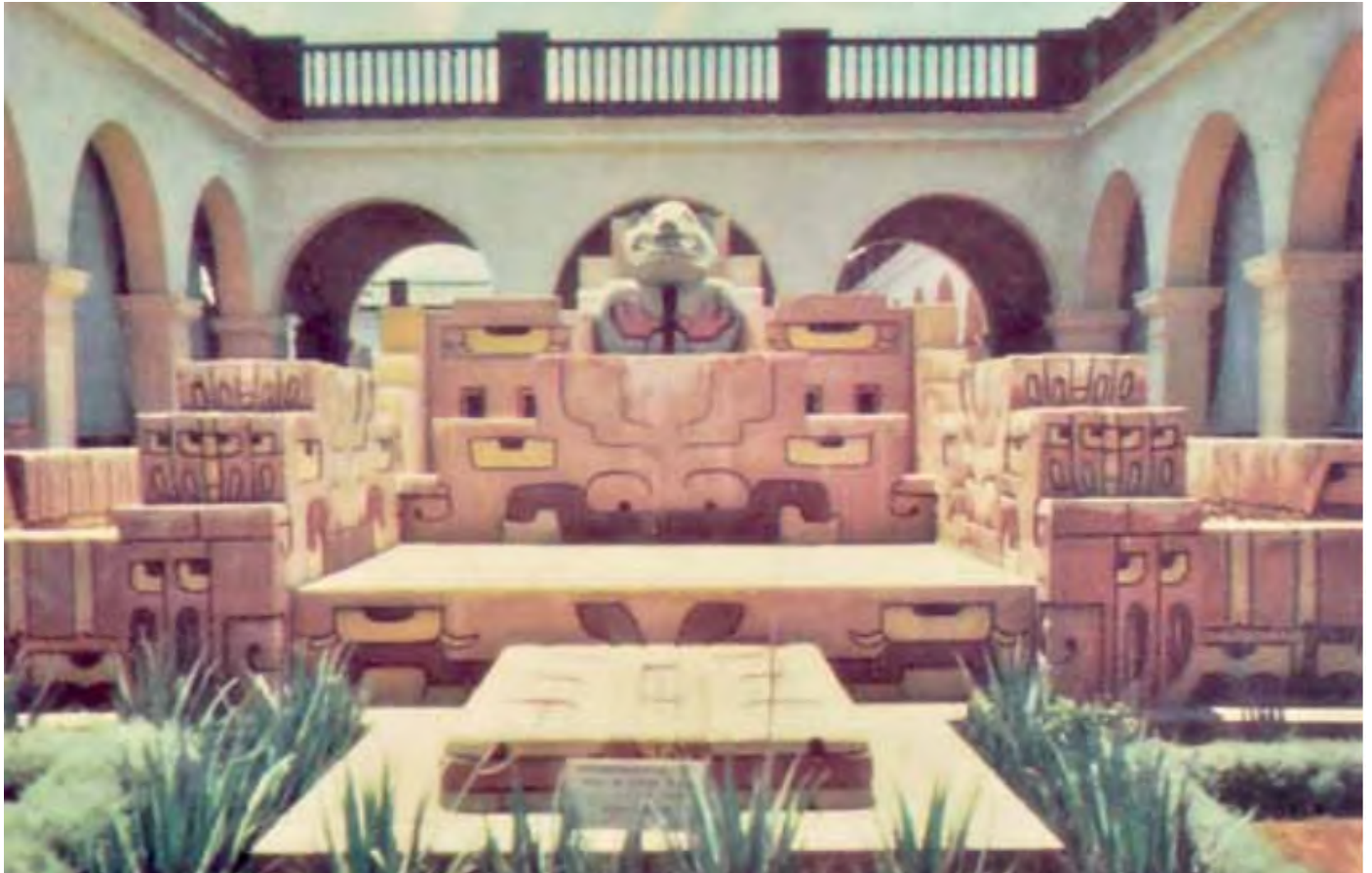
Interpretación de los templos de Cerro Blanco y Punkurí realizada por Julio C. Tello en 1938 en el Museo Nacional de Arqueología Antropología e Historia del Perú. Fotografía tomada de El neoperuano: arqueología, estilo nacional y paisaje urbano en Lima, 1910-1940 , p. 17.