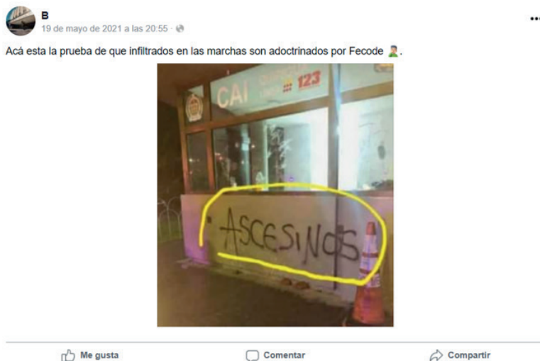
Figura 4. Ejemplo de 2021 de encadenamiento tópico del tipo [- Corrección ortográfica (- nivel educativo + criminalidad)] en comentario de Facebook

Varios encadenamientos tópicos pueden aparecer asociados a varios ideogramas. En el caso del i1 y del i3, se argumenta en relación con los topoi de la criminalidad y del nivel educativo. Es difícil aislar ambas cadenas tópicas en algunos comentarios en los cuales estos dos topoi parecen también relacionarse escalarmente, en un subnivel dentro del topos de la corrección ortográfica (Figuras 4 y 5):