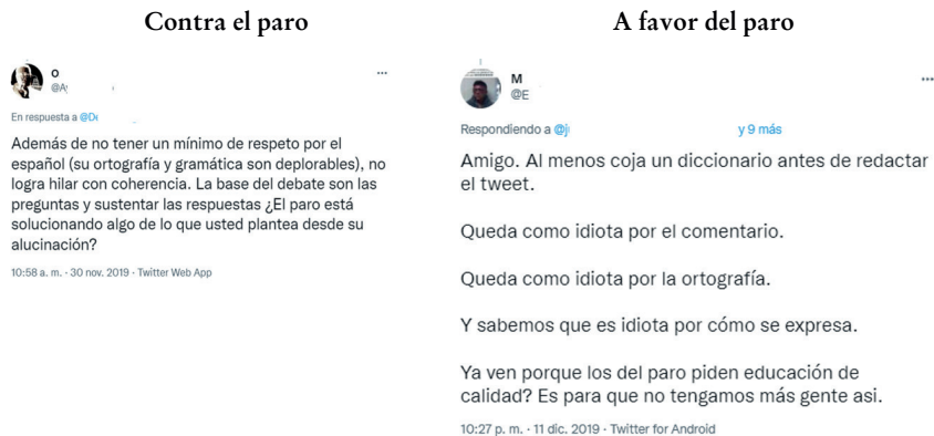
Figura 7. Ejemplos de 2019 del ideologema de la inteligencia

En el ejemplo anterior, hay una muestra de la recursividad fractal de los usuarios al pasar del nivel gramatical al nivel de la inteligencia del otro. De esta manera, se hace una relación entre el incumplimiento de la norma ortográfica, gramatical y estilo de escritura inadecuado con la falta de coherencia, educación e inteligencia del individuo que realiza el comentario. Este paso de nivel sin cuestionamiento muestra cómo los usuarios establecen una relación directa entre lo lingüístico y lo social, criticando de manera paralela la falta de normalización en la escritura, con lo que, para cada uno de los usuarios, puede catalogarse como un comportamiento social inadecuado. Desde este último eslabón de la cadena emerge, entonces, la postura de los sujetos a favor o en contra de la movilización social. Así, puede verse que iguales encadenamientos tópicos sobre el uso del lenguaje escrito pueden finalizar con la censura o el apoyo de la protesta.