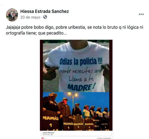
Figura 2. Ejemplo de 2021 de ideograma de inteligencia

En el segundo caso (i2: [+ corrección ortográfica + inteligencia]), el cuidado de la norma pasa a ser directamente proporcional a la inteligencia del usuario. En los comentarios sustentados sobre esta escala argumentativa, aparecen insultos y otras formas de la vituperación y de la burla para poner en duda la capacidad de razonamiento de la contraparte y sancionar las incapacidades que se les atribuye. La Figura 2 ilustra esta orientación argumentativa: