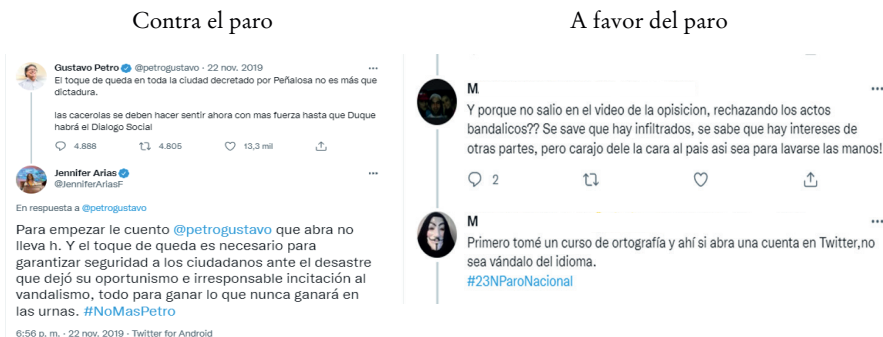
Figura 6. Ejemplos de 2019 del ideograma de la criminalidad 4

El segundo ideograma identificado en el paro de 2021 también aparece desde 2019. La cadena tópica [+ corrección ortográfica + inteligencia] opone a los bandos bajo el mismo argumento en espejo y la exclusión es simétrica, se esté a favor o en contra de las movilizaciones. Desde el 2019, la interincomprensión entre las partes se basa en el juicio sobre la irracionalidad del otro. La ortografía se presenta en cada caso como un saber mínimo o una habilidad básica de la que carece la contraparte y que refuerza tanto el posicionamiento solidario como el adverso a la protesta pública, como ejemplificamos en la Figura 7: